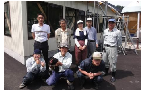
〔糸魚川市：ワークセンターにしうみの皆さん〕