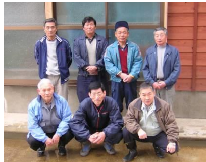
〔長岡市：菅畑にいがた地鶏生産組合の皆さん〕